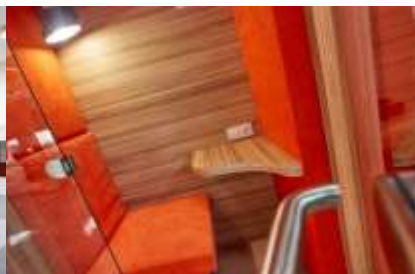
Комфортная зона ожидания