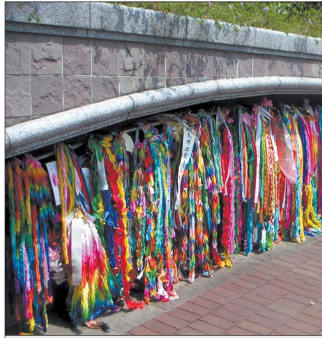
Нагасаки. Стена памяти