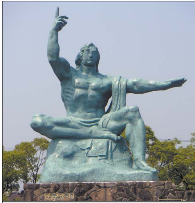
Нагасаки. Статуя мира

Огромное количество разноцветных бумажных журавликов, украшавших мемориал, оживило в моей памяти трогательную легенду. Много лет тому назад, в середине прошлого века, в далекой сказочной Японии жила девочка по имени Садако. Она любила свою родину, названную Страной восходящего солнца, где цвела сакура и летали воздушные змеи, где рисовали иероглифы и носили кимоно. Но однажды утром рай превратился в ад. Боги отвернулись от людей: с небес пришла смерть, неся боль, горе и разрушение. Черный саван укрыл два города — Хиросиму и Нагасаки, и Садако наравне с другими жителями