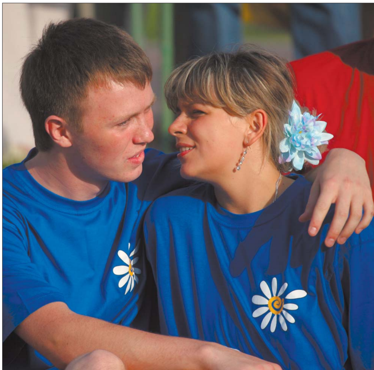
Фото: Олег Серебрянский