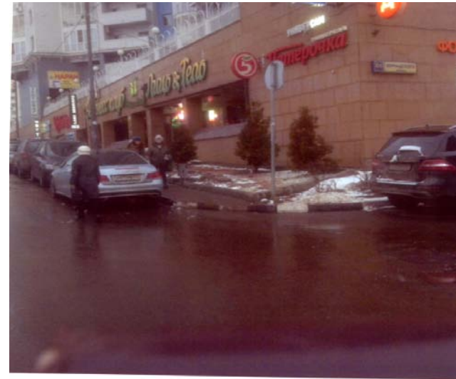
① Место установки выездного шлагбаума