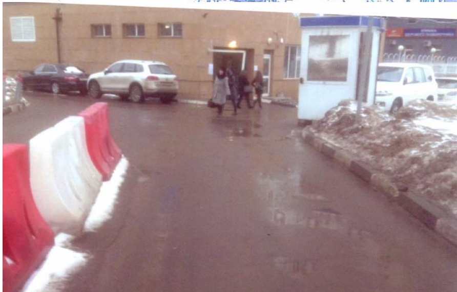
Место установки въездного шлагбаума