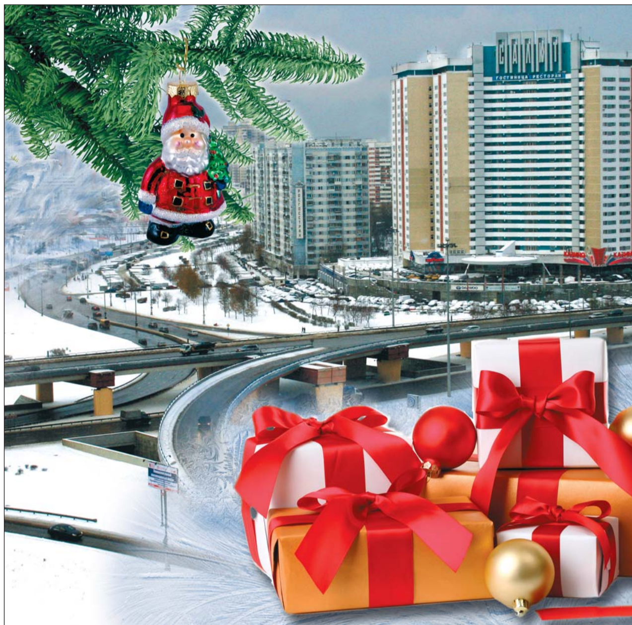
Коллаж: Римма Егорова