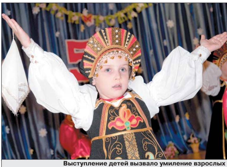
Выступление детей вызвало умиление взрослых