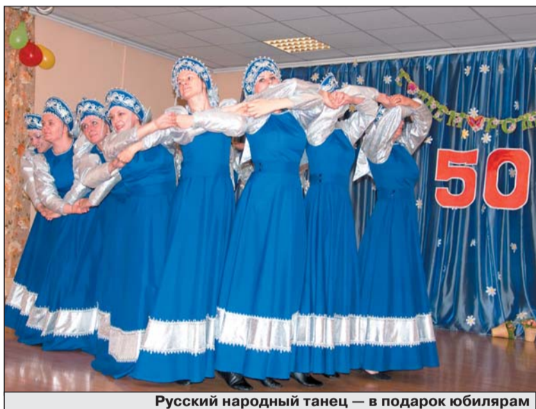
Русский народный танец — в подарок юбилярам

Праздник дружно отмечал весь педагогический коллектив, в составе которого 34 человека, и их гости. В честь юбилея дети и педагоги подготовили яркий и запоминающийся концерт.