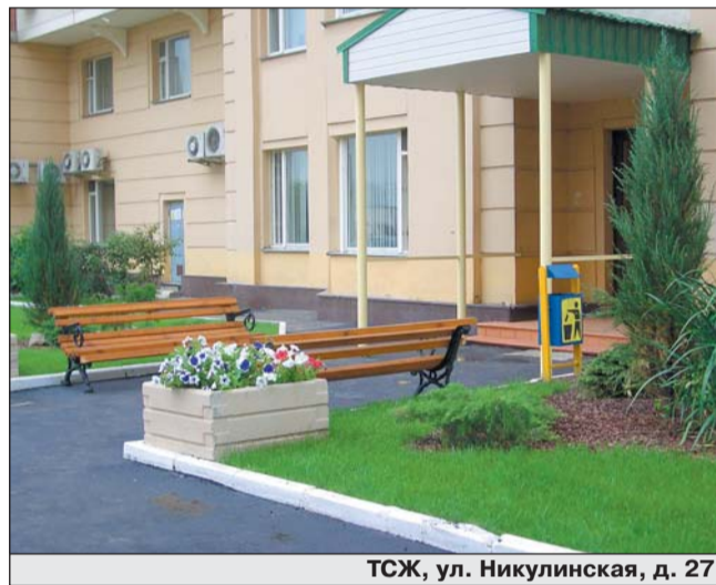
ТСЖ, ул. Никулинская, д. 27

— Им может быть гражданин либо юридическое лицо, являющееся собственником жилого или нежилого помещения в МКД. Если в доме есть жилые и нежилые помещения, находящиеся в собственности города, тогда на основании распоряжения Правительства Москвы № 1040-ПП от 14.05.08 инициатором проведения общего собрания собственников помещений по созданию ТСЖ может стать ГУ ИС вашего района.