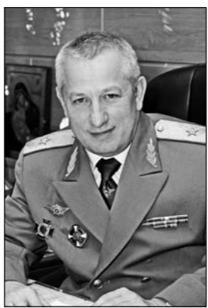
Примите самые искренние поздравления с Днем Великой Победы! Это действительно великий праздник — самый честный, самый чистый,