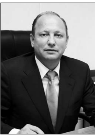
Сердечно поздравляю вас со знаменательным юбилеем — 65-летием Победы в Великой Отечественной войне!

Низко склоняем голову перед великим подвигом соотечественников, перед фронтовиками и тружениками тыла, вдовами и детьми войны и всегда будем помнить, какой ценой завоевана возможность мирно жить и строить будущее!