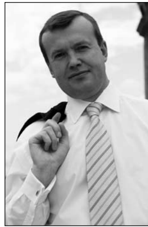
Примите самые искренние и сердечные поздравления с 65-й годовщиной Победы в Великой Отечественной войне!

Этому событию нет равных в истории человечества. Эта особая дата стала для всех символом национальной гордости и памяти.