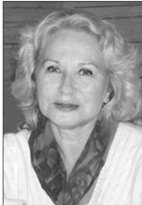
– Свою задачу я вижу в том, чтобы наш район, люди, которые ко мне обращаются, получили реальную помощь и поддержку.

– В чем Вы видите свою задачу как депутат?