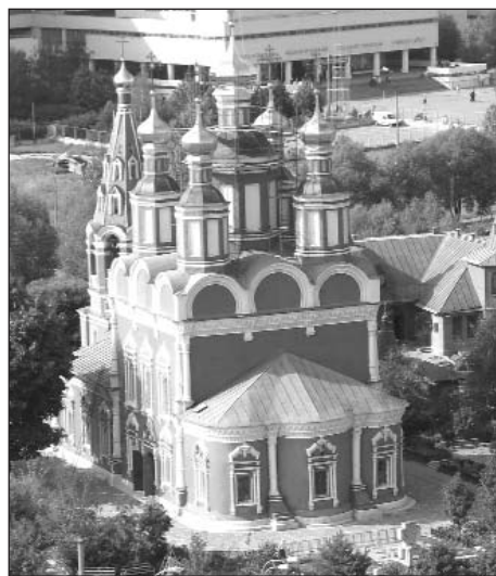
Район Тропарево-Никулино – один из престижных и благоустроенных районов Москвы. Этот высокий статус обусловлен его богатой историей – первое упоминание в летописях о деревне Тропа-

В этом году району Тропарево-Никулино исполнилось 16 лет!