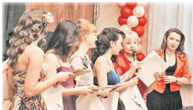
Золотые медалисты школы № 1307

Во всех школах Тропарево-Никулино прошли выпускные балы. Теперь уже бывшие ученики 11-х классов, оставив позади беспокойство и страх перед сдачей ЕГЭ, перевели дух и спокойно простились со своими одноклассниками и учителями. Девушки в бальных платьях необыкновенной красоты и молодые люди в пиджаках и галстуках выглядели в этот торжественный день один наряднее другого. Все они долго ждали этого момента, тщательно готовились, волновались. И вот он настал. Выпускники получили первый важный документ в жизни – аттестат о среднем образовании. А некоторые из ребят отличились особо и были награждены золотыми и серебряными медалями.