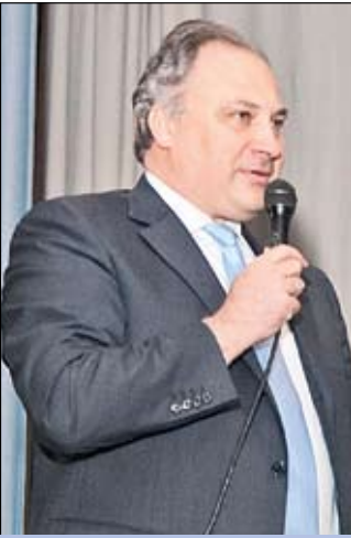
Префект Западного административного округа г. Москвы А.О. Александров