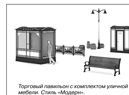
Торговый павильон с комплектом уличной мебели. Стиль «Модерн».

Несмотря на это, на территории района имеются проблемные зоны по обеспеченности населения предприятиями розничной торговли